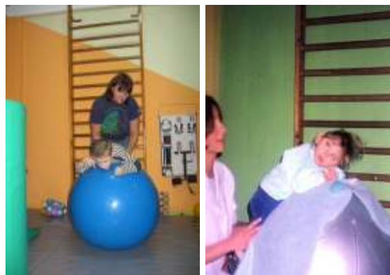
... Aktywna rehabilitacja

Nasza siedziba została niedawno wyremontowana dzięki zaangażowaniu i ciężkiej pracy członków oraz wolontariuszy Nadziei. Tutaj również odbywa się w tygodniu rehabilitacja dla niepełnosprawnych objętych opieką naszego Stowarzyszenia. Ćwiczenia organizujemy pod nadzorem wykwalifikowanego rehabilitanta. Cyklicznie organizujemy również zajęcia rehabilitacyjno - rekreacyjne na krytej pływalni.