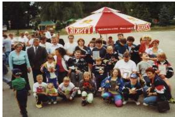
Libiąski Dzień Integracji, Sierpień 2000