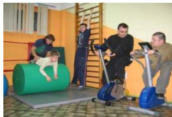
pod fachowym okiem fizjoterapeuty ...

Celem Stowarzyszenia jest organizowanie rehabilitacji ruchowej dla dzieci i młodzieży niepełnosprawnej, zapoznanie rodziców z możliwością kontynuacji ćwiczeń w warunkach domowych, zbieranie informacji dotyczących choroby, wymiana doświadczeń na temat wyników leczenia, integracja środowiskowa chorych dzieci i ich rodziców, organizowanie imprez integracyjno-kulturalnych, wycieczek turystyczno-krajoznawczych.