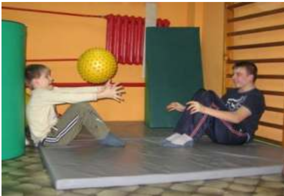
Rehabilitacja poprzez zabawę z piłką