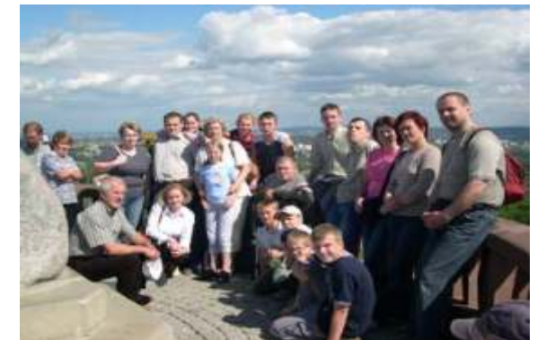
Kopiec Kościuszki, KRAKÓW 2005