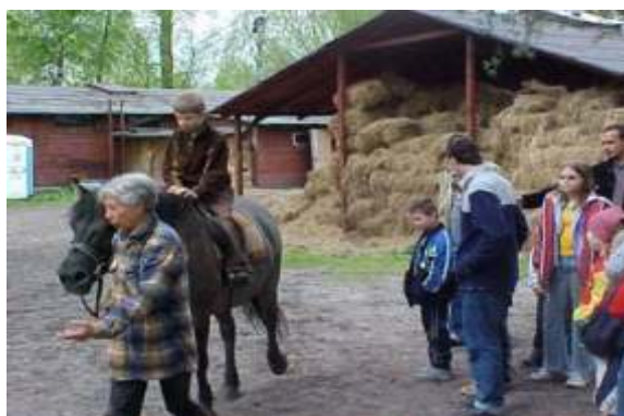
Stadnina Koni w Bołecinie, Maj 2005